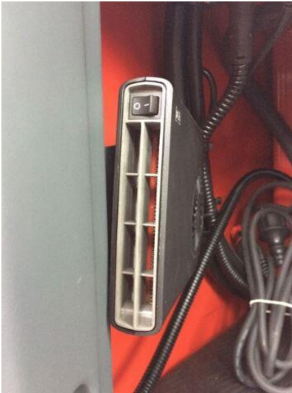
Hyttevarmer, elektrisk, 230 V inkl. Stikkontakt