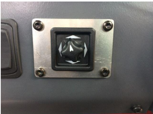
Utenfor speil, elektrisk oppvarmet og justert