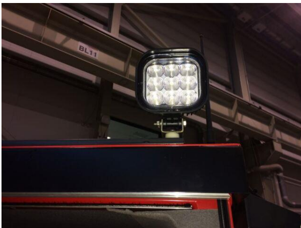
Ekstra fungerende lys ledet på hyttak, bakover, på motorens bakre hjørne av hytt Tak