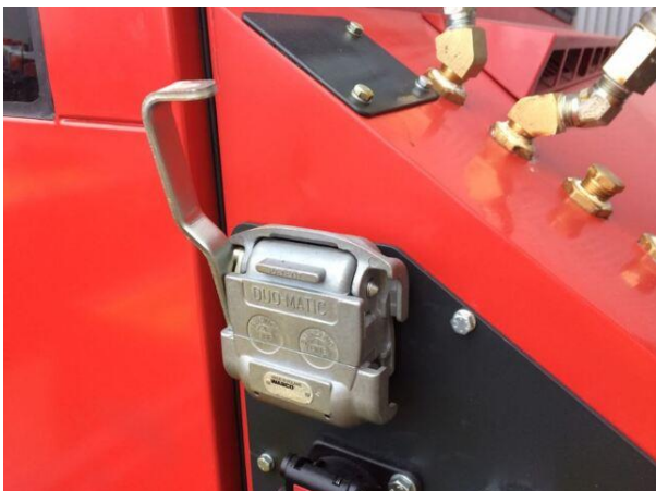
Duomatisk forbindelse på hytte bakvegg