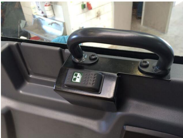
Elektrisk betjent førervindu