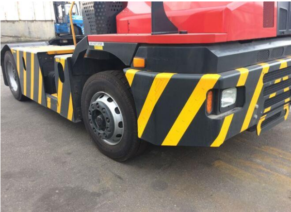
Gul sikkerhetsstriping på chassis