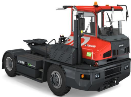
TR618I DSD -hytte, venstre hånd