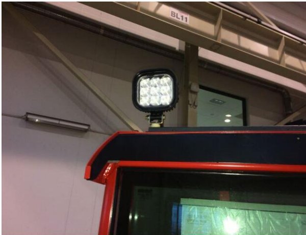
Ekstra fungerende lys ledet på hyttak, bakover, på førerens bakre hjørne av hytt Tak